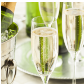
visitBerlin, Foto: GoArt! © Berlin