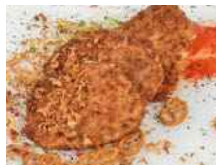
17.08 Kleine Braumeisterschnitzel vom Schwein pro Stück 3,60 €