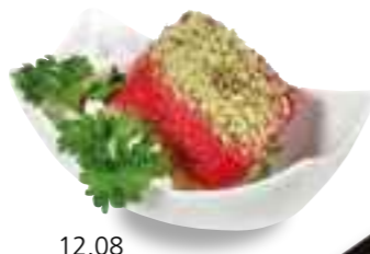
12.08 Cous-Cous Cous-Cous-Salat auf Berberitzen 3,20 €