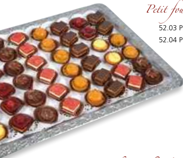
Petit fours Cafe Gourmand

52.05 Platte (48 Stück) 68,50 € 52.06 Platte (24 Stück) 47,50 €