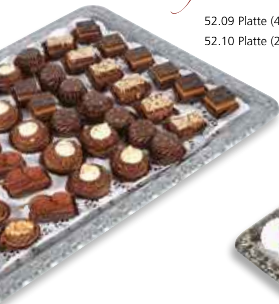
Petit fours Chocolate Dream

52.11 große Platte (48 Stück) 68,50 € 52.12 kleine Platte (24 Stück) 47,50 €