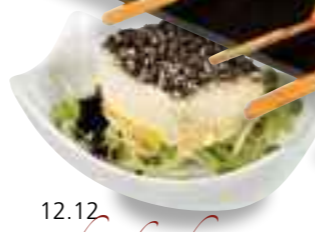
12.12 Shitakeschnitte an Sprossen* 2,90 €