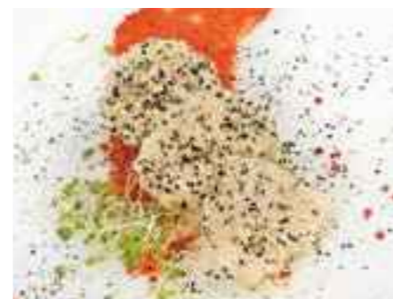
17.05 Kleine Hähnchensesamschnitzel pro Stück 3,60 €