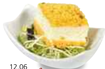
12.06 Würfel Gemüsemousse an Sprossen 2,90 €