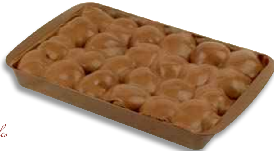
54.09 Italianische Schokoladen-Profiteroles

24 mit Vanillecreme gefüllte und mit Schokoladencreme überzogene Brandteigkugeln