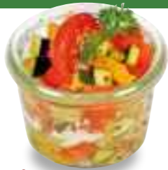
12.02 Mediterranes Gemüse mit Ziegenfrischkäse und Honig* 3,50 €