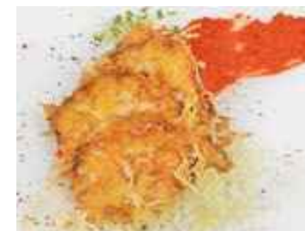
17.07 Kleine Schnitzel vom Schwein mit Käsepanade pro Stück 3,60 €