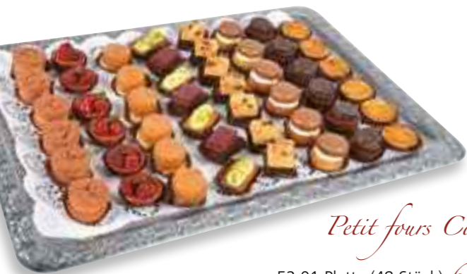
Petit fours Confiserie

52.01 Platte (48 Stück) 68,50 € 52.02 Platte (24 Stück) 47,50 €