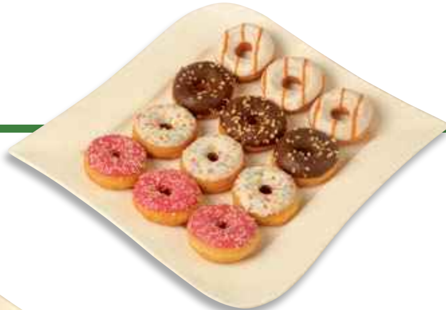
54.02 Mini Donuts