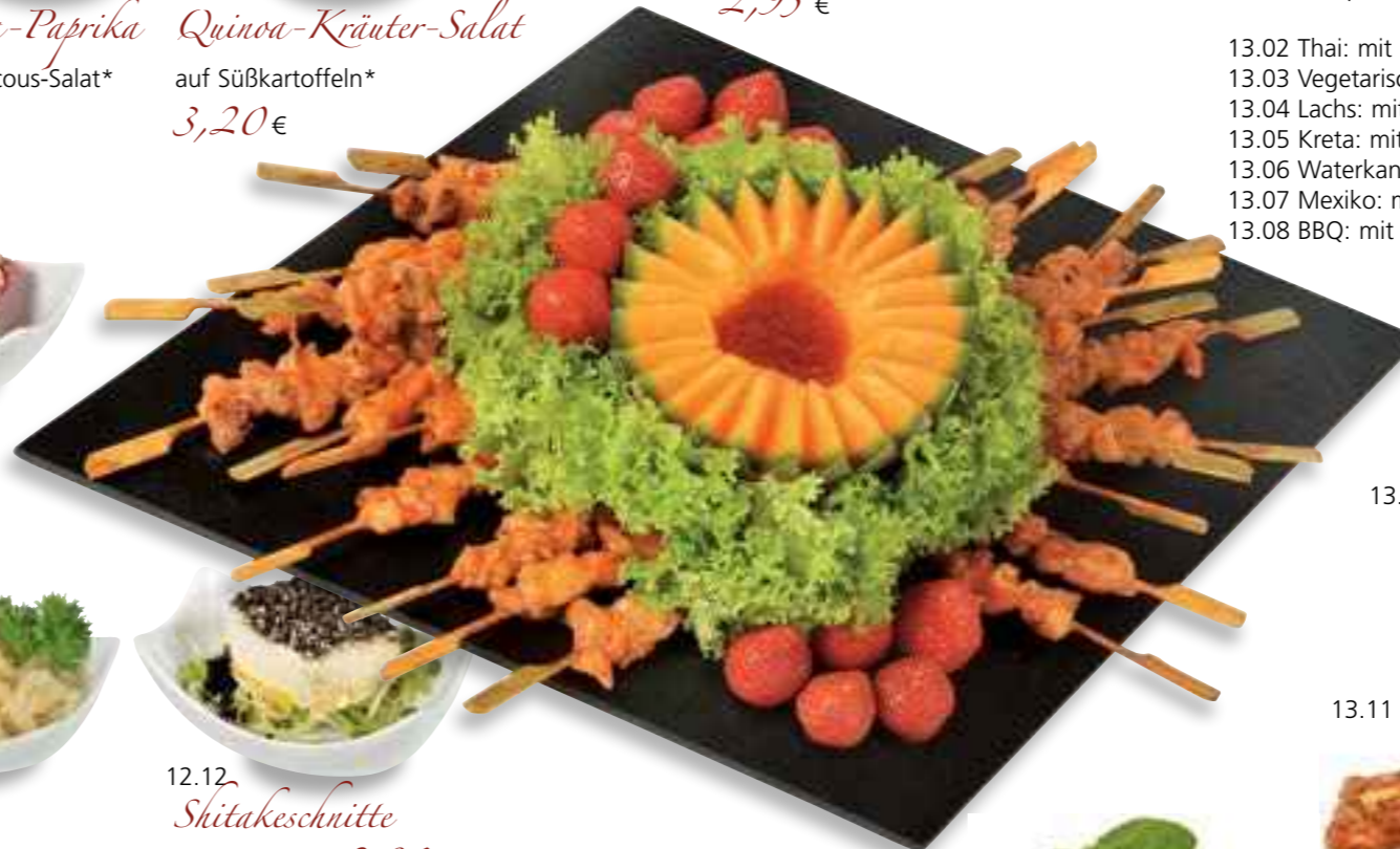
13.01 Yakitorispieße Süß-scharf marinierte Hähnchenspieße (ab 30 Stück erhältlich) pro Stück 2,95 €