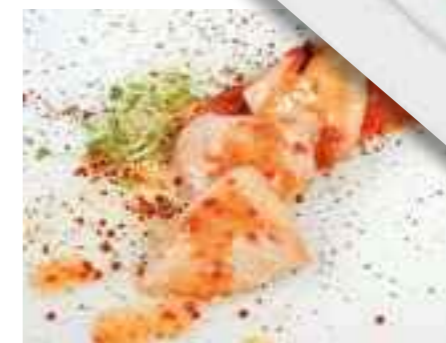
17.04 Kleine Hähnchensteaks „Thai Art“ pro Stück 3,60 €