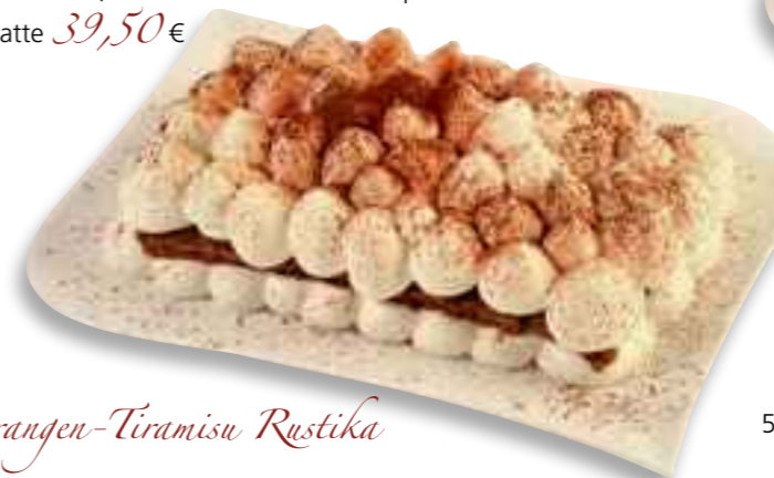
53.09 Orangen-Tiramisu Rustika

zwei mit Orangenlikör beträufelte Biskuitböden, bedeckt mit einer Mascarponecreme, die mit frischer Orange abgerundet wird je Platte 39,50 €