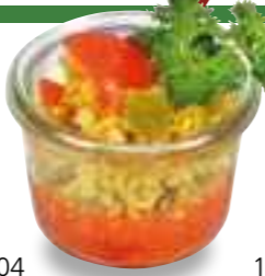
12.04 Harissa-Paprika mit Couscous-Salat* 3,20 €