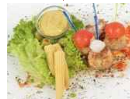
17.10 Kleine Partyboulettchen pro Stück 1,20 €

(17.02 bis 17.10 - Mindestbestellmenge 10 Portionen)