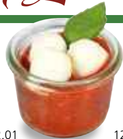
12.01 Tomatenkompott mit Mozzarella und Basilikum* 3,50 €