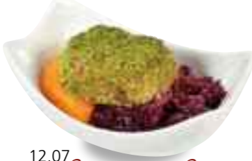
12.07 Schweinebäckchen an Rotkohl mit Thymianmousse 4,35 €