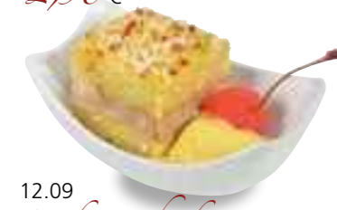
12.09 Kokos-Chicken-Sesamwürfel mit Indian Curry 3,70 €