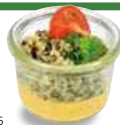
12.05 Quinoa-Kräuter-Salat auf Süßkartoffeln* 3,20 €