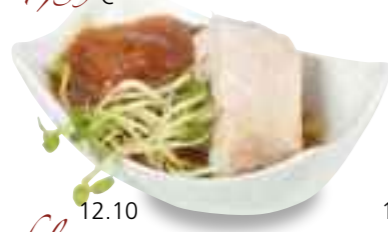
12.10 Onion-Bacon-Jam mit Hähnchen 3,70 €