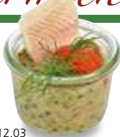
12.03 Linsensalat mit geräucherter Forelle 4,20 €