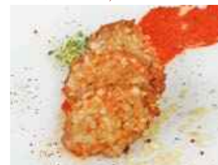
17.09 Kleine Schnitzel vom Schwein mit Mandelpanade pro Stück 3,60 €