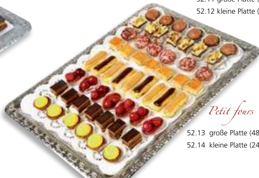
Petit fours Wiener Charme

52.09 Platte (48 Stück) 68,50 € 52.10 Platte (24 Stück) 47,50 €