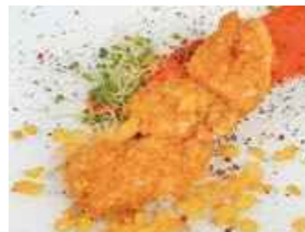
17.03 Kleine Hähnchenknusperschnitzel pro Stück 3,60 €