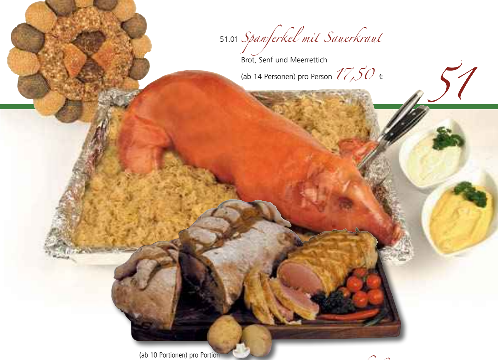
(ab 10 Portionen) pro Portion