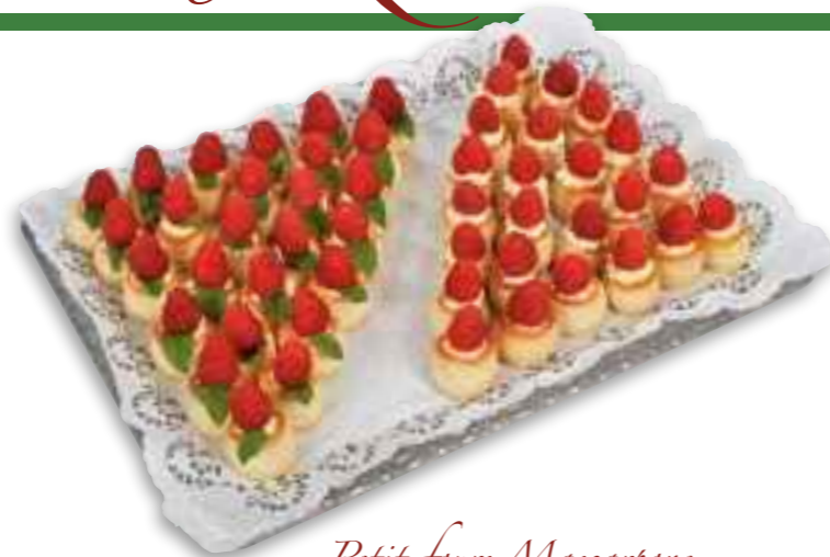
Petit fours Mascarpone-Himbeer-Tortelettes

52.01 Platte (48 Stück) 68,50 € 52.02 Platte (24 Stück) 47,50 €