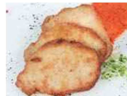
17.06 Kleine panierte Schnitzel vom Schwein pro Stück 3,50 €