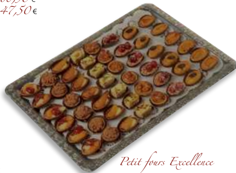
Petit fours Excellence

52.03 Platte (48 Stück) 68,50 € 52.04 Platte (24 Stück) 47,50 €