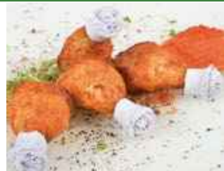
17.02 Knusprige Hähnchenschkel pro Stück 3,50 €