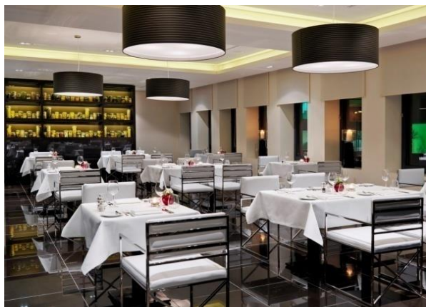
Restaurant „Salt & Pepper“

Unser Restaurant „Salt & Pepper“ mit erlesener mediterraner und internationaler Küche, eine Lobby Bar, ein Business Corner und eine Tiefgarage (kostenpflichtig) mit direktem Hotelzugang runden das Angebot ab. Ab diesem Frühjahr steht nun auch ein Außenbereich in Form einer charmanten Berliner Innenhofterrasse zur Verfügung, die sich hervorragend für kleinere Veranstaltungen eignet.