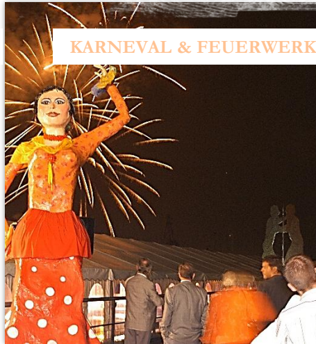
KARNEVAL & FEUERWERK