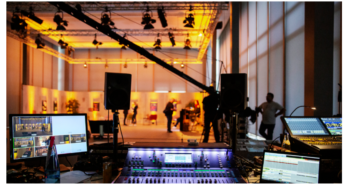
SQUARE ENIX | Gamescom