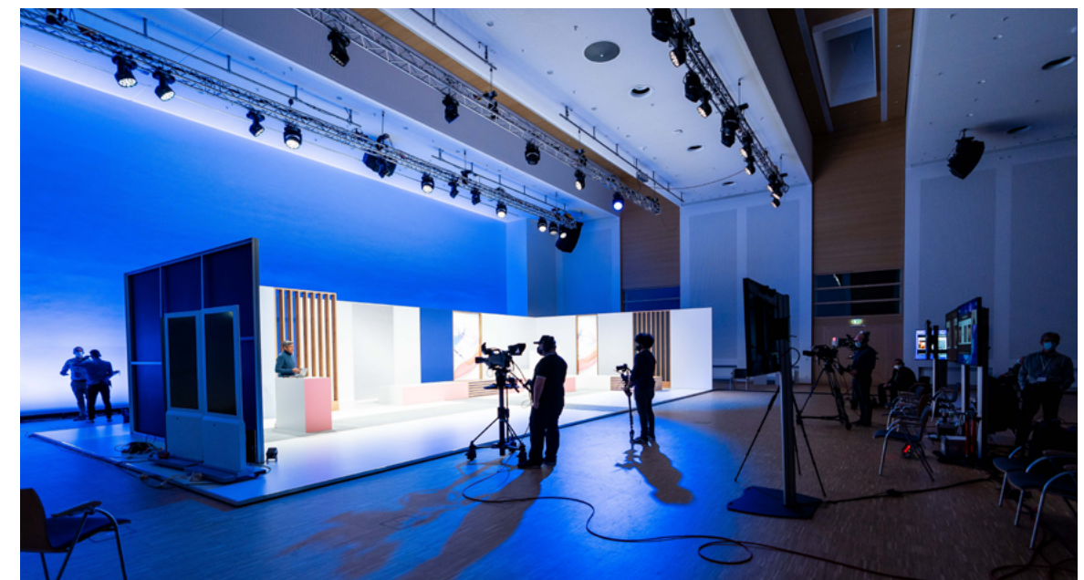
IBM | Think Digital Summit