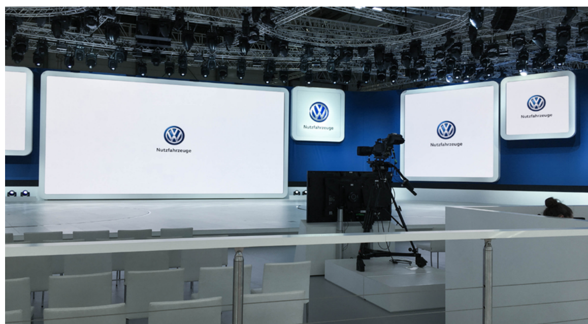
VW | IAA Nutzfahrzeuge