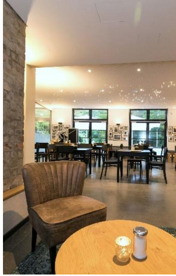
CAFÉ NORDSTERN – PLANETARIUM HAMBURG