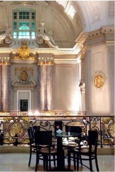
CAFÉ BODEMUSEUM BERLIN