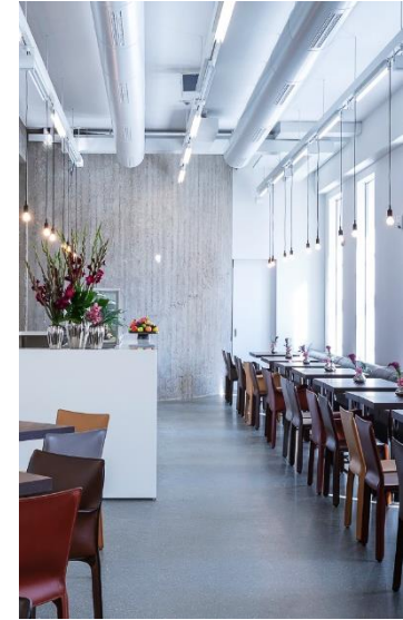
LEPOPULAIRE – BERLIN

Zusätzlich zu exklusiven Locations betreibt KOFLER & KOMPANIE auch deutschlandweit Gastronomien. Neben der Museumsgastronomie gehören auch Restaurants dazu, wie das LePopulaire Unter den Linden in Berlin, das jüngst im Herbst 2018 eröffnete. Die Räumlichkeiten können immer auch für private oder Firmenevents exklusiv gebucht werden.