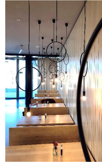
RESTAURANT M1 BMW MUSEUM MÜNCHEN