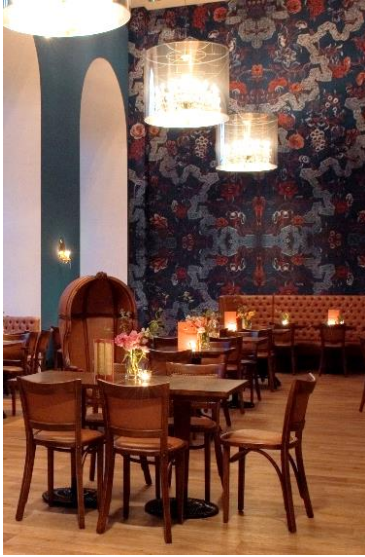
CAFÉ IM ZEUGHAUS – DEUTSCHES HISTORISCHES MUSEUM BERLIN