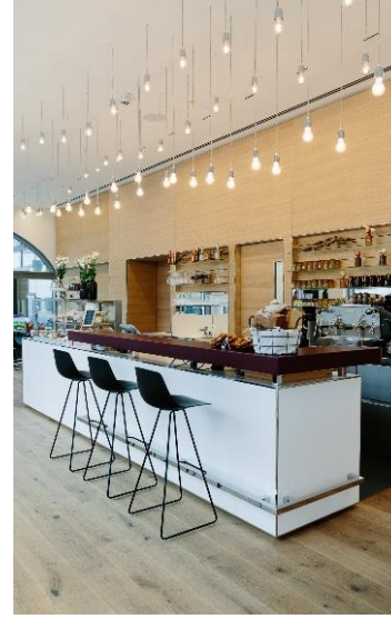
CAFÉ MO66 – BMW GROUP CLASSIC MÜNCHEN