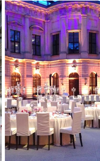
DEUTSCHES HISTORISCHES MUSEUM