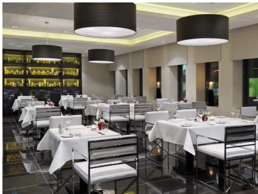
Restaurant „Salt & Pepper“

Unser Restaurant „Salt & Pepper“ mit erlesener mediterraner und internationaler Küche, eine Lobby Bar, ein Business Corner und eine Tiefgarage (kostenpflichtig) mit direktem Hotelzugang runden das Angebot ab. Ab diesem Frühjahr steht nun auch ein Außenbereich in Form einer charmanten Berliner Innenhofterrasse zur Verfügung, die sich hervorragend für kleinere Veranstaltungen eignet.