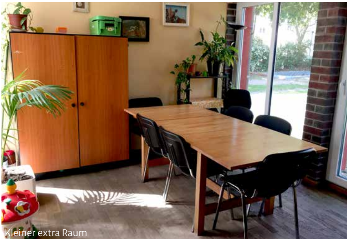
Kleiner extra Raum