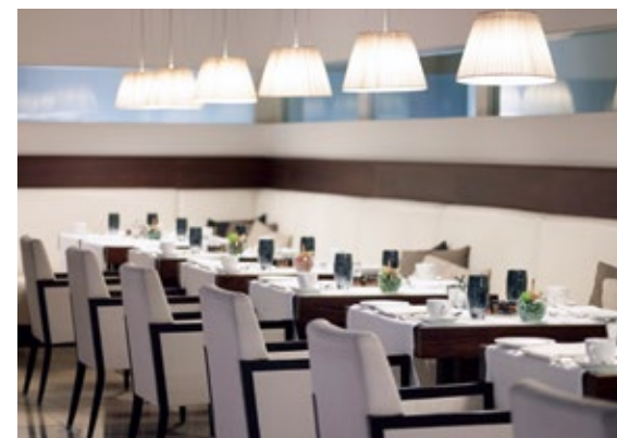
The Atrium Cafe

Das Hotel liegt im historischen Stadtkern, gegenüber vom Gendarmenmarkt, nur 15 km vom Flughafen Berlin Tegel, 2,5 km vom Hauptbahnhof und 10 km von der Autobahn entfernt.