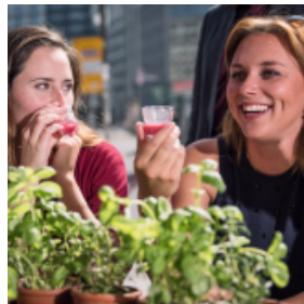
Benedikt Haack © Photography