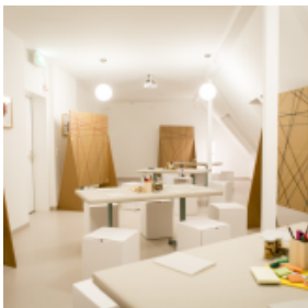
visitBerlin, Foto: Mike © Auerbach