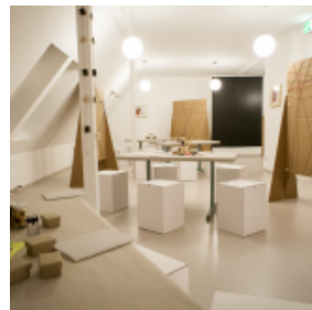
visitBerlin, Foto: Mike © Auerbach