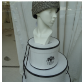
Claudia Häuser-Mogge © Berlin