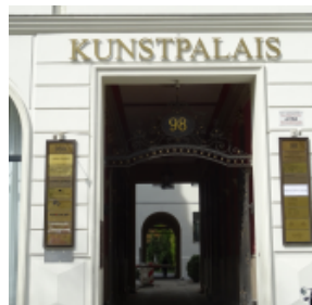
Claudia Häuser-Mogge © Berlin