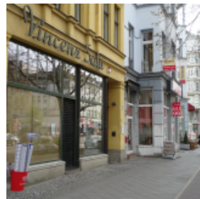
Claudia Häuser-Mogge © Berlin