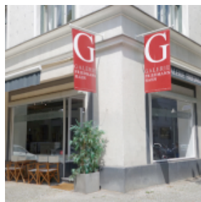
Galerie Friedmann-Hahn © Berlin