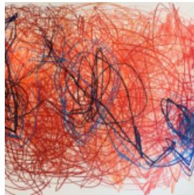
visitBerlin , Foto: Grand © Hyatt Berlin