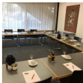
Foto: Tagungsraum Theodor